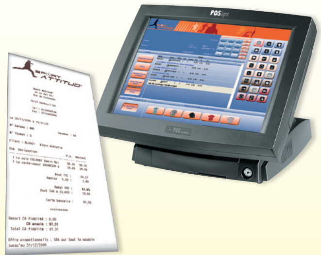
Personnalisez votre écran de vente et vos tickets de caisse