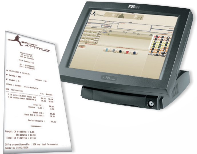
Personnalisez votre écran de vente et vos tickets de caisse